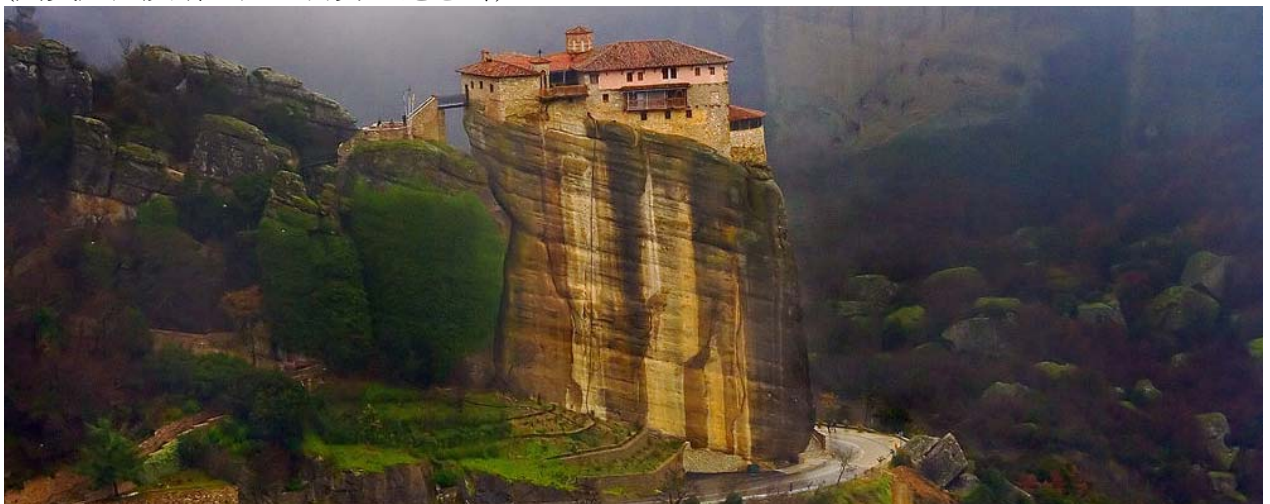
麥提奧拉的修道院

卡蘭巴卡，天空之城麥提奧拉 Meteora*，聖三一修道院 St Trinity Monastery，溫泉關 Thermopylae (列奧尼達及斯巴達三百勇士紀念碑)。