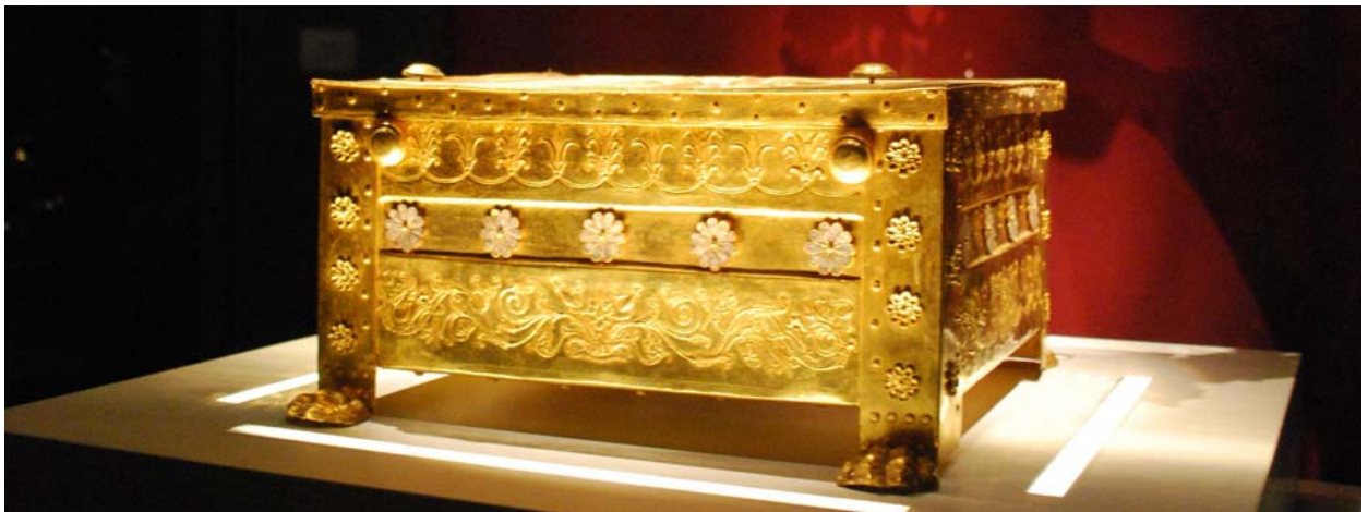
亞歷山大大帝的父親腓力二世的陪葬品

埃格 Vergina/Aigai* (古城廢墟遺址，衛城，王家墓塚 Great Tumulus of Aigai，博物館，王宮，亞歷山大大帝出生地)，保羅傳福音的庇哩亞。